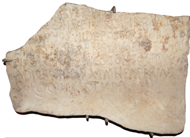
Iscrizione funeraria della bimba Marina

N. LAMBOGLIA, La scoperta della Basilica cimiteriale di San Vittore ad Albenga , in Rivista Ingauna e Intemelina , n.s., XI, 1956, 1, pp. 1-9.