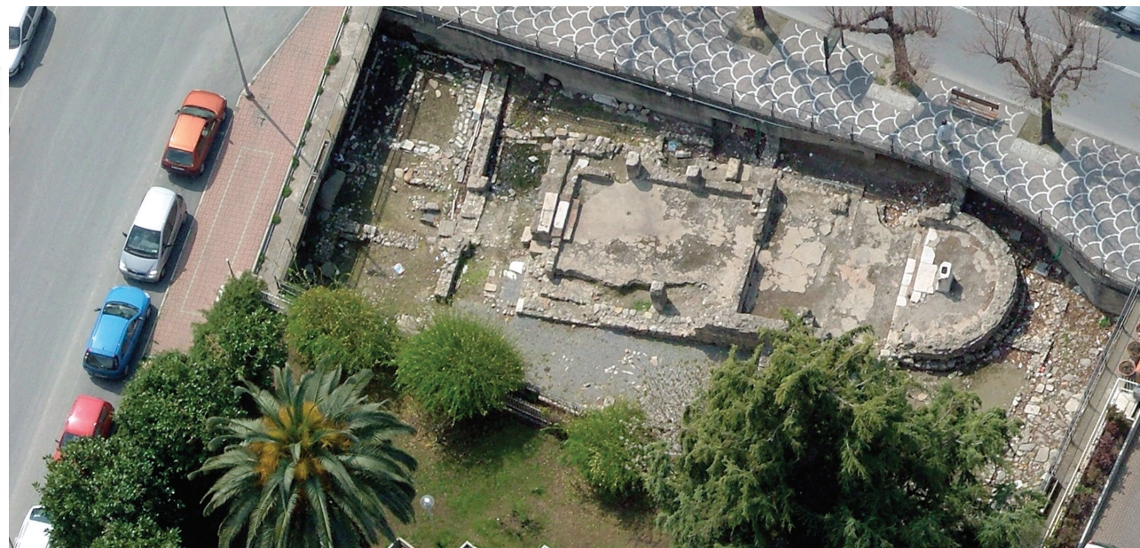
Planimetria e foto aerea dell'area archeologica