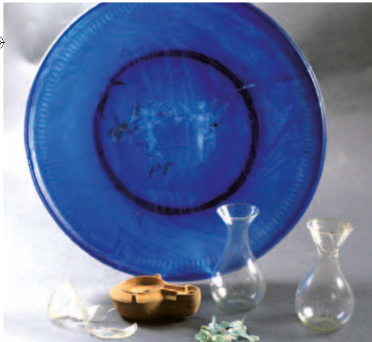
Corredo della tomba 26 del recinto funerario II

A partire dal IV sec. d.C., prima che fosse abbandonata ed interrata definitivamente dalle alluvioni del Centa, l'area fu gradualmente occupata da numerose inumazioni a fossa e alla cappuccina, prive di corredo. La destinazione cimiteriale della zona era già nota dal XVIII secolo quando, tra il 1715 e il 1722, nel corso dei lavori di scavo per la costruzione del santuario di N.S. di Pontelungo furono scoperte un'urna cineraria in marmo bianco del I sec. d.C. e due tombe a cremazione in anfora.