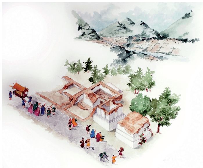
Disegno ricostruttivo della necropoli settentrionale di via Pontelungo

Della necropoli romana, tardoantica e altomedievale di Albenga sono state finora individuate due aree adiacenti al Viale Pontelungo, il cui tracciato, da Porta Molino fino al Ponte Lungo, si sovrappone a quello dell'antica via Iulia Augusta . La prima di queste aree è ubicata attorno ai ruderi della chiesa di