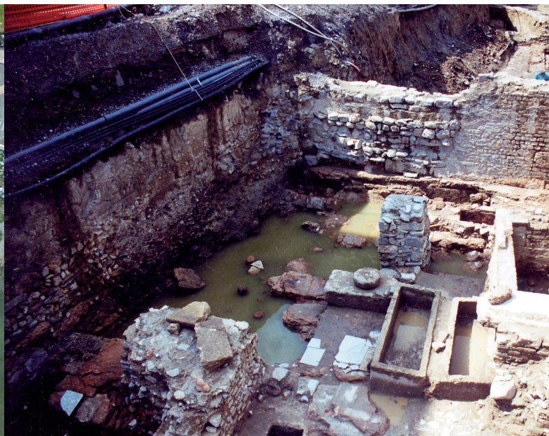
Cimitero tardoantico e altomedievale durante gli scavi