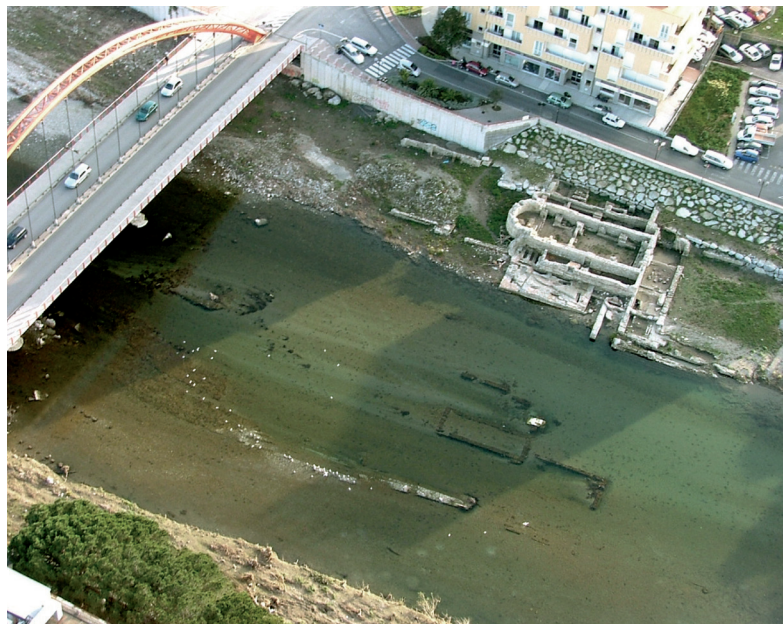
San Clemente

Sui resti del calidarium delle terme venne costruito, forse nella prima metà del V secolo, un importante complesso religioso cristiano, che comprendeva vasca battesimale ed annesso cimitero, quest'ultimo consistente in un ampio recinto che si sviluppò nel periodo tardoantico ed altomedievale. La fase successiva del complesso è costituita dai ruderi della chiesa di San Clemente, che fu edificata probabilmente nel XIII secolo sui resti della chiesa più antica e su una parte del cimitero. Notizie della chiesa si hanno ancora nel XVI e XVII secolo, mentre scompare del tutto nel 1900.