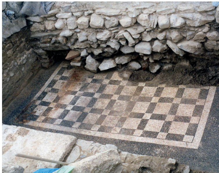
Mosaico delle terme romane sotto il complesso di S. Clemente

L'area in cui sorgono le terme e la chiesa di San Clemente faceva parte del suburbio di Albingaunum , sviluppatosi a partire dalla prima età imperiale nella breve piana posta a sud della città antica, nelle vicinanze della via Iulia Augusta . La zona è oggi attraversata dal Centa, il quale anticamente (fino al XIII secolo) scorreva invece a nord della città. Nel corso del tempo, dopo la sua edificazione, la chiesa di San Clemente fu sottoposta a continue trasformazioni, anche per adattarne l'accessibilità a seguito del progressivo innalzamento del livello del suolo circostante dovuto agli apporti alluvionali del Centa. Nella sua ultima fase di vita, la chiesa, chiusa da un rozzo muro trasversale, fu accorciata drasticamente all'altezza dell'abside e trasformata in una semplice cappella campestre. Il fonte battesimale, inquadrabile tra il V ed il VI secolo, riveste eccezionale importanza per le implicazioni con la storia più antica della diocesi di Albenga e non desta sorpresa che un complesso battesimale sia stato impostato su un edificio termale romano, dato che il rituale antico prevedeva l'immersione del catecumeno.