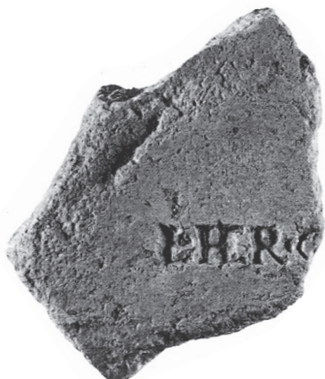
Frammento di tegola romana con marchio di fabbrica: L. HER(ennius) O[pt]i[at]us : I-II secolo d.C.

La presenza del monumento funerario, solitamente prospiciente una strada, come pure l'ubicazione stessa della villa di Bussana e di altri siti rurali costieri (come la villa della Foce e l'insediamento presso Riva Ligure) rappresentano indicatori indiretti di un asse stradale litoraneo, riconducibile più o meno direttamente alla via Iulia Augusta , costruita unificando più antichi segmenti viarii a partire dal 13-12 a.C. dall'imperatore Augusto fino a Nizza - presso la quale venne costruito un grande monumento celebrativo (il Trofeo della Turbie) - in collegamento con la viabilità dei centri romani della Provenza.