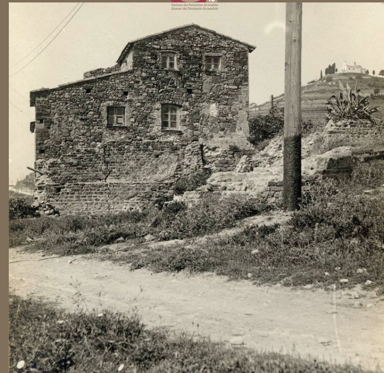
FOTO E DISEGNI: ©Archivi Soprintendenza Beni Archeologici della Liguria