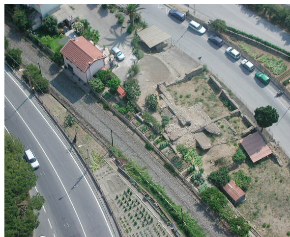
Foto aerea dei resti della villa