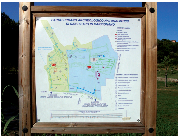
Pannello didattico del parco