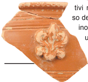
Coppa in sigillata italica (I secolo d.C.)

iniziale in età augustea con significativi restauri ed ampliamenti nel corso del I secolo d.C. I reperti ceramici, inoltre, testimoniano la continuità di uso di questo edificio sino al V - VI secolo d.C.