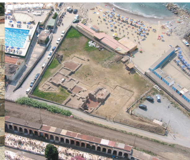
Sopra - I resti moderni sovrapposti alle murature romane in foto degli anni '30 del XX sec. Murature pertinenti alla prima fase della villa emerse nel 2002 (scavi Soprintendenza)