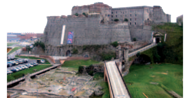
Complesso Monumentale del Priamàr