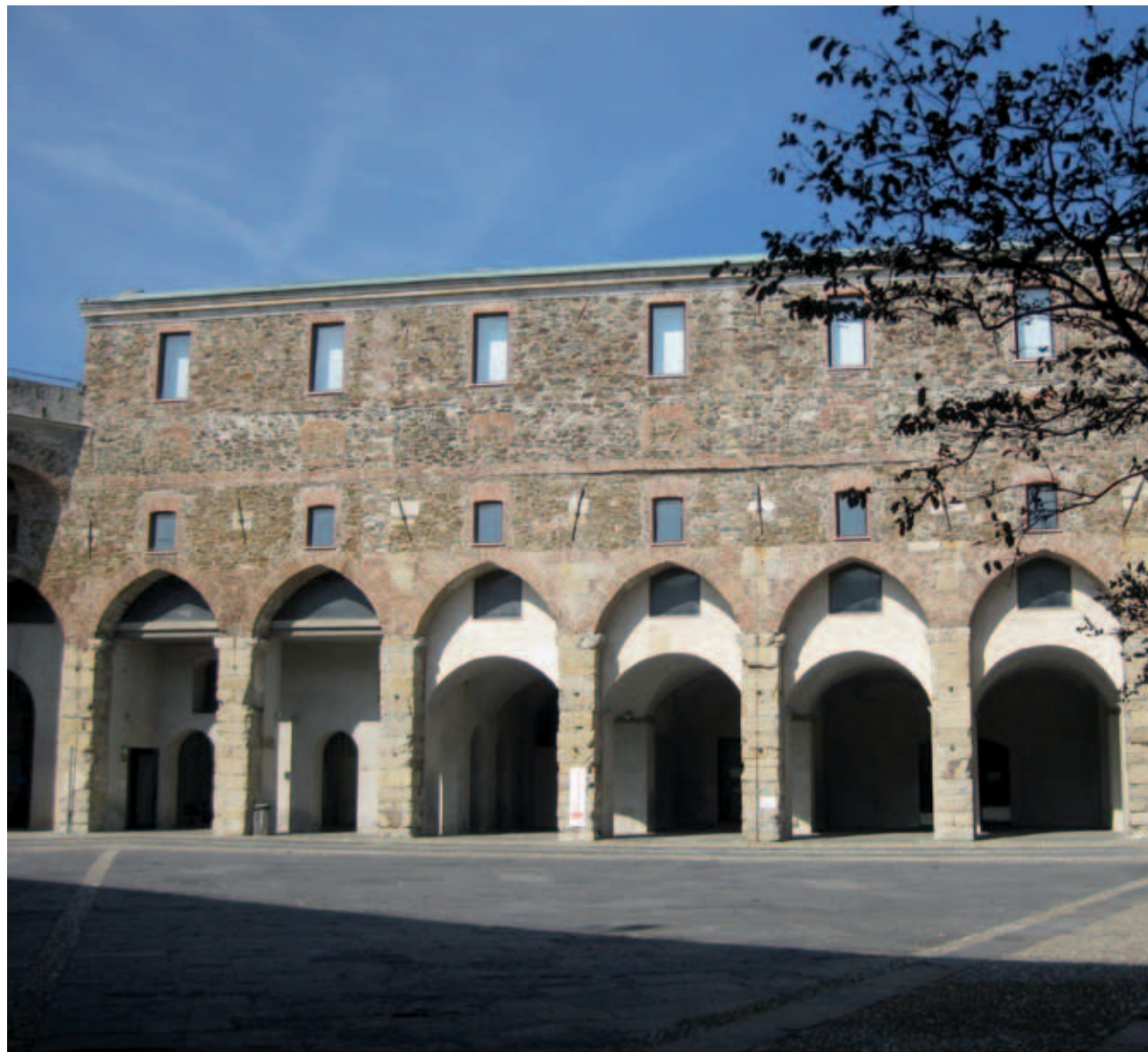
Palazzo della Loggia, sede del Civico Museo Archeologico e della Città