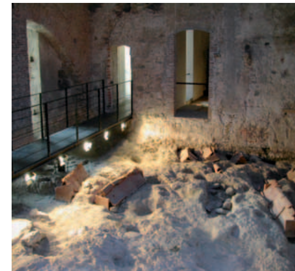
Due particolari dell'area archeologica musealizzata all'interno degli spazi espositivi