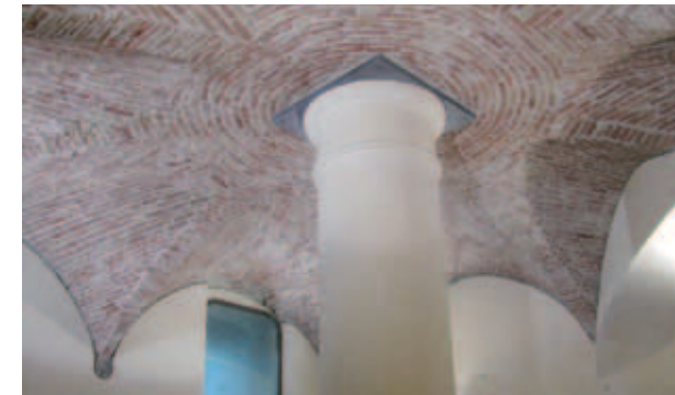
Particolare dell'interno del museo