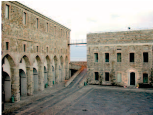
Piazzale d'Armi del Maschio

Il Civico Museo Archeologico e della Città è collocato al piano terra e al primo piano del palazzo della Loggia nel Complesso Monumentale del Priamàr, oggetto di prolungate campagne di scavo che hanno messo in luce le tracce del primitivo insediamento savonese riferibile al Bronzo Medio (XV sec. a.C.). È stata rinvenuta una vasta necropoli di IV-VII secolo, visibile all'interno del percorso museale, e le successive testimonianze alto e basso medievali fino alle strutture militari del sito. La fortezza del Priamàr venne fatta costruire dalla Repubblica di Genova tra il 1542-43 su progetto di G.M. Olgiate, con lo scopo di proteggere, da un lato, il proprio territorio da possibili attacchi provenienti dallo stato sabauda e, dall'altro, di tenere sotto controllo la città di Savona che, nel 1528, era stata definitivamente sottomessa con l'interramento del porto. Per far posto ai poderosi bastioni, che si adeguano al meglio alle caratteristiche morfologiche dell'altura, vennero distrutti, sull'alto del colle, la Cattedrale, il Palazzo vescovile, i dieci oratori delle Confraternite e, alle sue falde, la chiesa e convento di S. Domenico con l'omonima contrada. Altri importanti