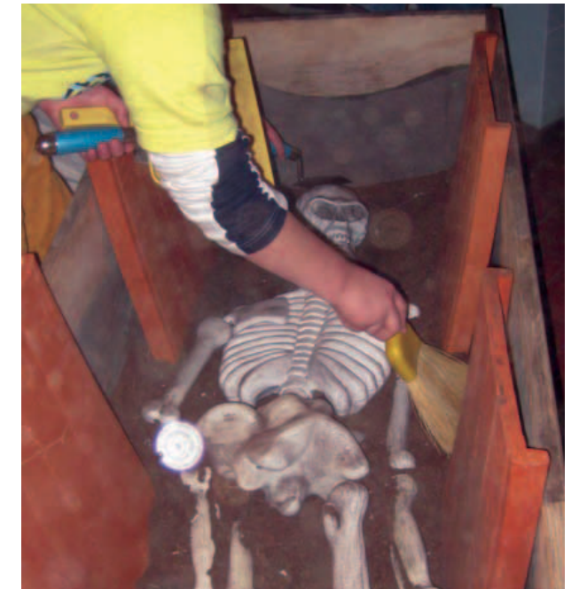
Due momenti dell'attività didattica