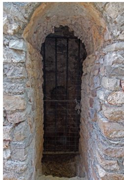
FOTO E DISEGNI: ©Archivi Soprintendenza Beni Archeologici della Liguria